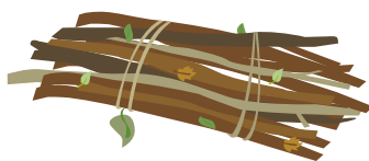
BRANCHAGES DE MOINS DE 6 CM DE DIAMÈTRE AVEC LIENS NATURELS (pas de lien en plastique, ni en fer)

LES DÉCHETS VÉGÉTAUX DÉPOSÉS EN VRAC SUR LE SOL NE SERONT PAS COLLECTÉS