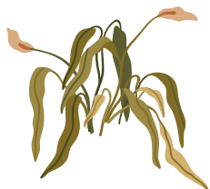
PLANTES ET FLEURS FANÉES