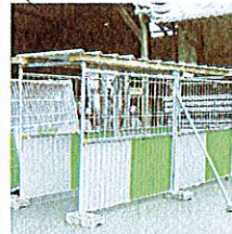
Modèle passage piéton protégé largeur adaptée à la largeur du trottoir existant